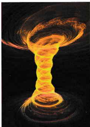
△ Transa sibilelor a fost indusă de deversarea gazelor din sol.

pasiv identificabil în natura feminină. Prezicătoarele proveneau în principal din cele mai umile clase ale societății și erau virgine și foarte tinere. Este dificil să ne imaginăm că o fată de rând a reușit să dețină o astfel de poziție autoritară, dar trebuie spus că acestor vizionari nu li s-a solicitat nicio pregătire specială, deoarece capacitatea lor profetică derivă doar din starea de transă cauzată de inhalarea gazelor prezente în cameră și ingestia de ierburi cu puteri halucinogene, precum dafinul, o plantă sacră pentru Apollo.